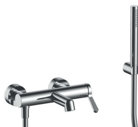
ART. L915 Miscelatore vasca esterno, interasse bocca 18 cm / Cartuccia tradizionale. Wall-mount bathtub mixer, spout projection 18 cm / Traditional cartridge. Mitigeur bain-douche externe, entraxe bec 18 cm / Cartouche traditionnelle. AP-Wannenmischer, Achsabstand Auslauf 18 cm / Standardkartusche. Monomando bañera externo, distancia a chorro 18 cm / Cartucho tradicional.