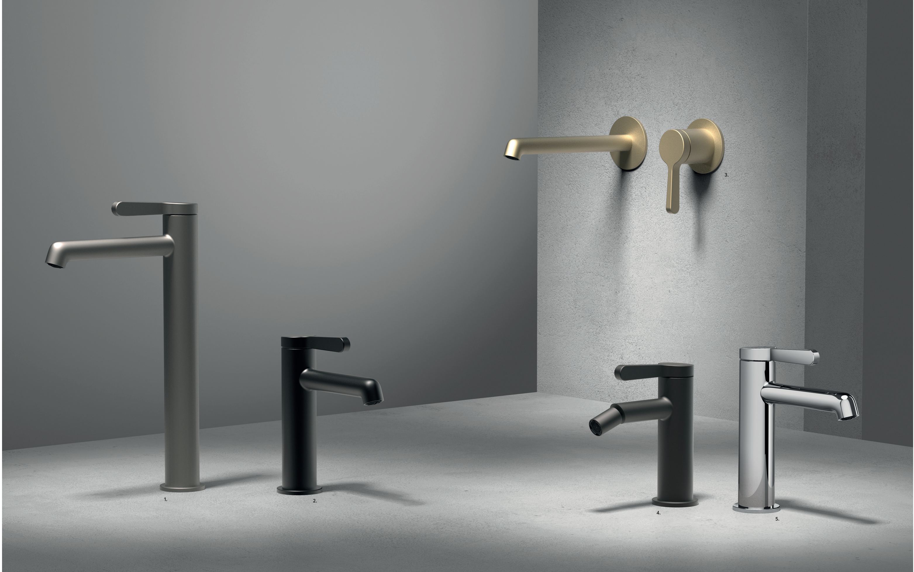
[ 1. P5 MATT GUN METAL PVD 2. 13 MATT BLACK 3. P6 MATT BRITISH GOLD PVD 4. S1 DEEP BLACK PVD 5. 02 CHROME ]