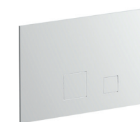
8403 Placca di comando per cassette di scarico. Materiale di base: acciaio. Flush actuator plat. Base material: stainless steel. Plaque de déclanchement pour réservoir. Matériel de base: acier. Betätigungsplatte. Basismaterial: Edelstahl. Placa y pulsador descarga inodoro. Material básico: acero.