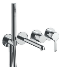
ART. L921B+D220A Miscelatore vasca incasso, interasse bocca 20 cm / Cartuccia tradizionale. Built-in bathtub mixer, spout projection 20 cm / Traditional cartridge. Mitigeur bain-douche à encastrer, entraxe bec 20 cm / Cartouche traditionnelle. UP-Wannenmischer, Achsabstand Auslauf 20 cm / Standardkartusche. Monomando baño/ducha empotrado, distancia a chorro 20 cm / Cartucho tradicional.