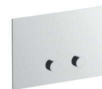
8402 Placca di comando per cassette di scarico. Materiale di base: acciaio. Flush actuator plat. Base material: stainless steel. Plaque de déclanchement pour réservoir. Matériel de base: acier. Betätigungsplatte. Basismaterial: Edelstahl. Placa y pulsador descarga inodoro. Material básico: acero.