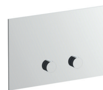
W216 Placca di comando per cassette di scarico. Materiale di base: acciaio. Flush actuator plat. Base material: stainless steel. Plaque de déclanchement pour réservoir. Matériel de base: acier. Betätigungsplatte. Basismaterial: Edelstahl. Placa y pulsador descarga inodoro. Material básico: acero.